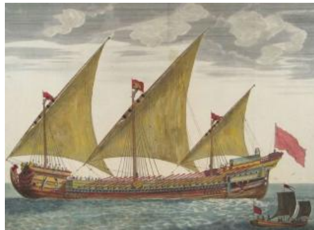
Ilustración de una galeaza.