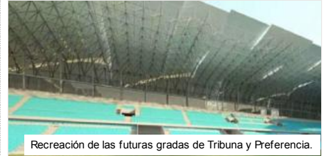
Recreación de las futuras gradas de Tribuna y Preferencia.

Contenido exclusivo para suscriptores digitales